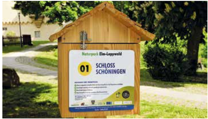
Auch am Schloss Schöningen haben Wanderer künftig die Möglichkeit, ihr Wanderstempelbuch mit einer Prägung zu versehen

Zu kaufen gibt es die neuen Wanderstempelbücher »Naturpark Elm-Lappwald erleben« ab sofort in allen Buchhandlungen, Touristinformationen und online in zwei Verpackungseinheiten: Wanderstempelbuch plus Karte für 7 Euro (Buch Erwachsene plus Übersichts Karte plus Zugang zur kostenlosen Smartphone-App) sowie Wanderstempelbuch-Familienpaket für 10 Euro (Buch Erwachsene plus zwei Bücher Kinder plus Übersichts Karte plus Zugang zur kostenlosen Smartphone-App für die ganze Familie).