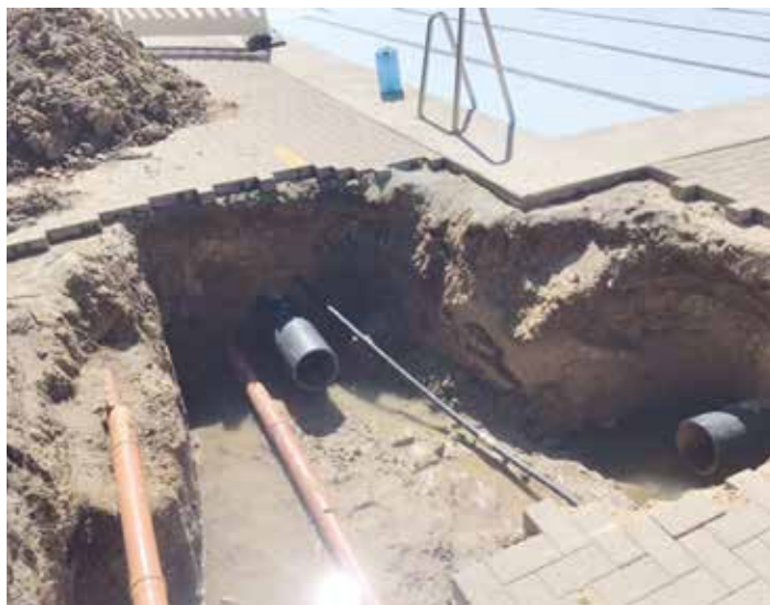
Ein defekter Absperrschieber im Schöppenstedter Freibad verhinderte, dass Wasser in das Becken eingelassen werden konnte. Da eine Reparatur nicht möglich war, muss das 300 Kilogramm schwere Teil komplett ausgetauscht werden