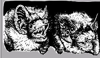
Fledermausschutz an Gebäuden Quartiere schaffen und erhalten

Gegen Einsendung von fünf Briefmarken zu 70 Cent erhalten Sie unsere Broschüre