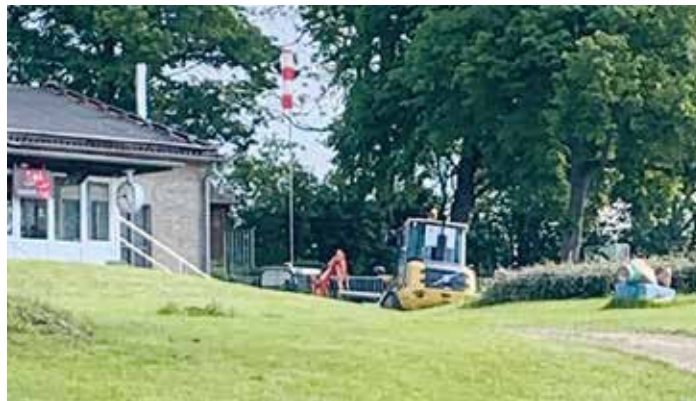
Anfang dieser Woche rollte im Schöppenstedter Freibad schweres Gerät der Fachfirma an, die sich um den Austausch des defekten Schiebers kümmert