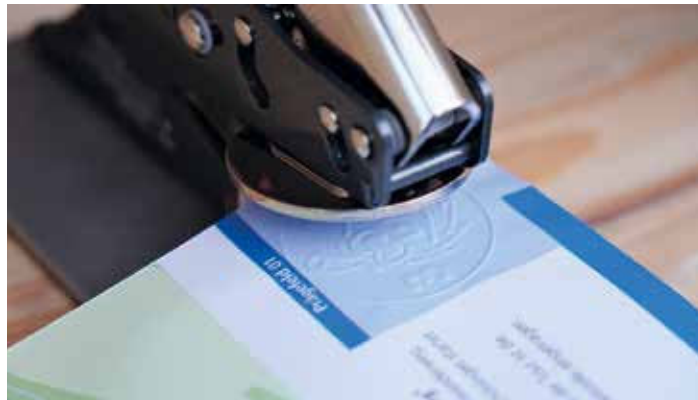
Die Stempel werden – ohne Stempelfarbe – geprägt