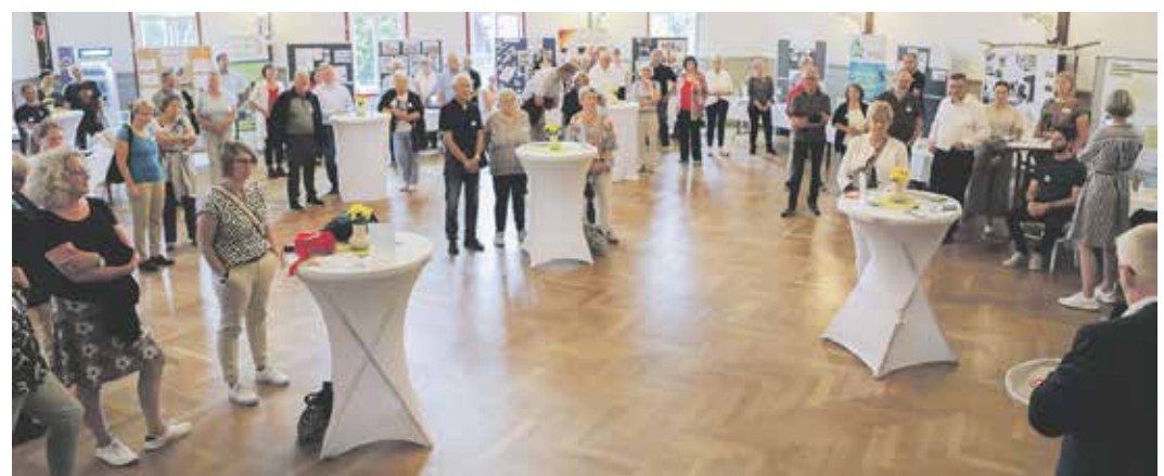
»Markt der Möglichkeiten«: Viele Ehrenamtliche präsentierten ihre Herzensprojekte

Die Stiftung selbst informierte zusammen mit den LEADER-Management Elm-Schunter und Nördliches Harzvorland im großen Saal über ihre Projektantragsverfahren und gemeinsame Fördermöglichkeiten. Für den Bereich »Das Ehrenamt stärken« standen