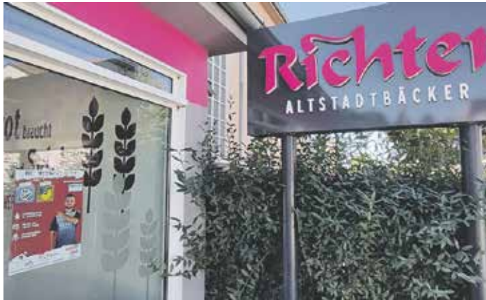
Ein Plakat beim weiteren Sponsor, der Bäckerei Richter. Es kündigte die Landesliga-Partie des sechsten Spieltags der ersten Herrenmannschaft MTV Wolfenbüttel gegen FC Germania Bleckenstedt

gans, der zudem ehrenamtlich für den Bereich Sponsoring aktiv ist, begeistert von der neuen Kooperation: »Der Start in die Zusammenarbeit war so herrlich unkompliziert. Mit dem Plakatdruck können wir nun viel breiter kommunizieren und die Leute ins Stadion locken für