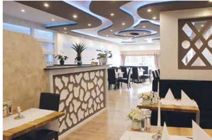
Blick in den geschmackvoll eingerichteten Gasträum

stolz, unseren Gästen ein Stückchen unserer Heimat erlebbar machen zu dürfen«, so Kurti abschließend. as