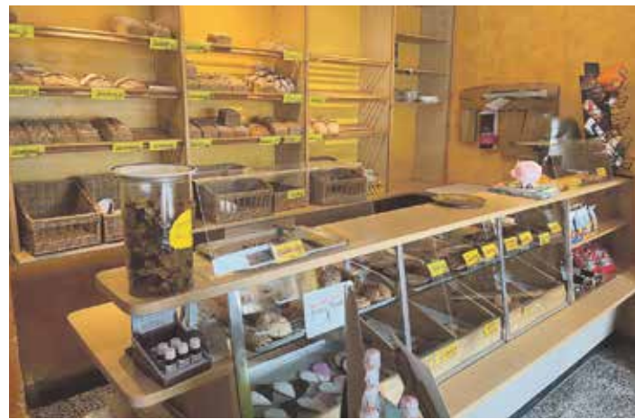
Der Geschäftsverkauf der Bio-Bäckerei am Elm befindet sich an der Dorfstraße 20 in Evessen. Hier finden Kunden eine breite Auswahl an Bio-Backwaren sowie weitere Spezialitäten von Kuchen und Kleingebäck bis hin zu erlesenen Weinen

Hier ist die Bio-Bäckerei am Elm für Sie da: Geschäftsstandort Evessen, Dorfstraße 20 (Dienstag bis Freitag von 7 bis 12 Uhr und 15 bis 18 Uhr, Sonnabend von 7 bis 12 Uhr); Wochenmarkt Schöppenstedt (Freitagvormittag); Wochenmarkt Königslutter (Donnerstagvormittag); Wochenmarkt Wolfenbüttel (Sonnabendvormittag); Campuswochenmarkt Braunschweig (Dienstagnachmittag) und Altstadt-Wochenmarkt Braunschweig (Sonnabendvormittag).