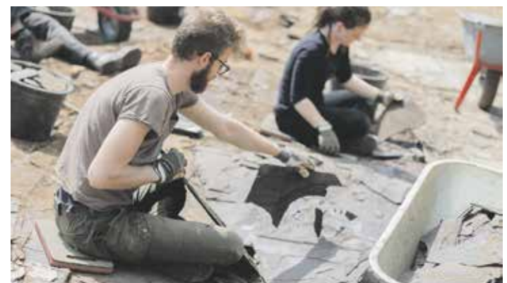
Der Geopunkt Jurameer in Schandelah

Ebenfalls bereits etabliert und geschätzt ist der Tag des Geotops am Geopunkt Jurameer Schandelah. Hier veranstalten das Naturhistorische Museum Braunschweig, die Dr.-Scheller-Stiftung, die Gemeinde Cremlingen und der Geopark von 10 bis 16 Uhr ein kunterbuntes Programm, u. a. mit Führungen an der Grabungsstelle.