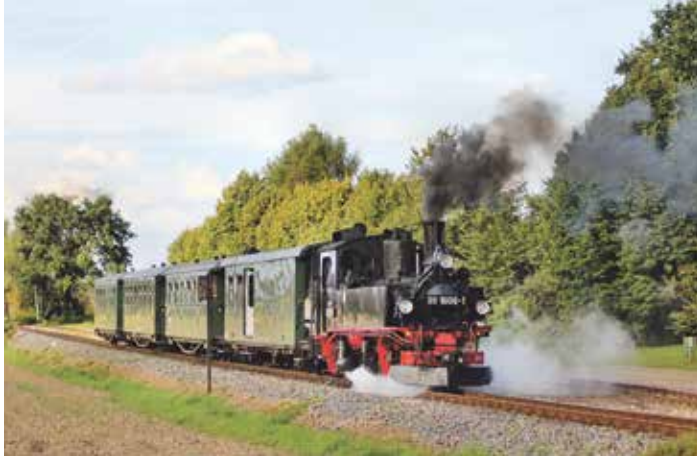
Wird am Eisenbahnwochenende im Mansfelder Land als Gastlok fungieren: die sächsische IV K

Die 991608-1 von der Sächsischen Dampfisenbahngesellschaft mbH (SDG) wird im Mansfelder Land als 99608, die letztgebaute ihrer Art, unterwegs sein. Bereits 1951 bis 1954 dampften Lokomotiven dieser Baureihe durchs Mansfelder Land. Damals als sozialistische Hilfe der Deutschen Reichsbahn, um im Mansfelder Land die erhöhten Transportaufgaben der Bergwerksbahn des Mansfelder Kombinats abzusichern. Somit besteht hier ein direkter geschichtlicher Bezug zu den sächsischen IV K, der vor allem Eisenbahnfreunden und Eisenbahnfotografen ein besonderes Erlebnis sein wird. Insgesamt werden drei Lokomotiven auf