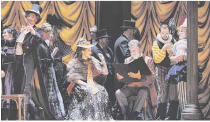
Szene aus »La bohème«

»La bohème« – Wiederaufnahme der so berührenden wie romantischen Inszenierung Ben Baus aus der Spielzeit 2018/19,