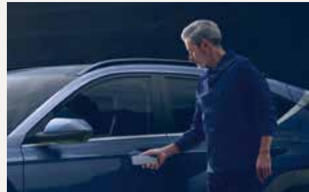
Digitaler Fahrzeugschlüssel 1,2

Abbildung zeigt aufpreispflichtige Sonderausstattung.