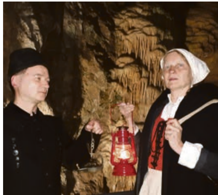
Kiepenfrau und Bergmann in der Iberger Tropfsteinhöhle

Die Veranstaltung dauert etwa eineinhalb Stunden, vorher ist ein Besuch des archäologischen Museums im HEZ möglich. Die Laternen stellt das HEZ. Die Kosten betragen für Erwachsene 12,50 Euro sowie für Kinder und Jugendliche bis 17 Jahre 8 Euro. Die Laternenreise ist ausschließlich buchbar mit Anmeldung bis zwei Tage vor Veranstaltungsbeginn unter info@hoehlen-erlebnis-zentrum.de . Weitere Informationen gibt es unter 05327/829391.