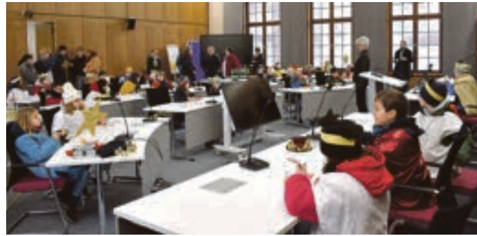
Die Schulkinder übernahmen für eine kurze Zeit den Kreistag und bildeten das Parlament der Sternsinger

Neben einer Spende für die Sternsinger-Aktion gab es für die zahlreichen Caspares, Melchiores und Balthasars Süßigkeiten und Getränke. In den Tagen darauf besuchten die Kinder dann mehr als 200 Privathaushalte. Zudem standen Besuche von Seniorenheimen, von Kitas, der Peter-Räuber-Schule sowie ein Empfang beim evangelischen Landesbischof an.