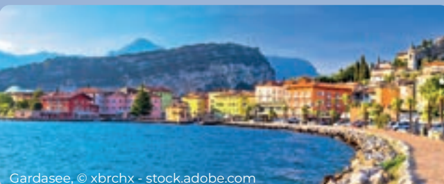
Gardasee, © xbrchx - stock.adobe.com