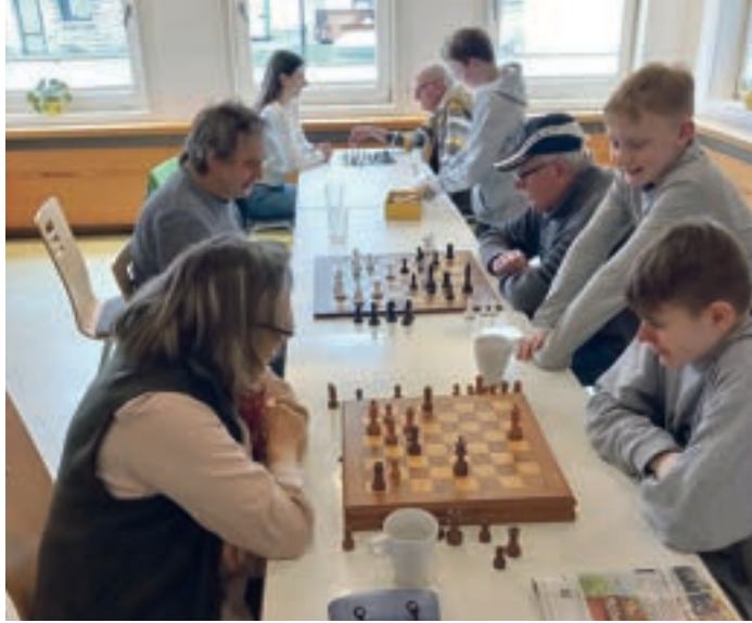
Schachspielen im Projekt »Segensreich«