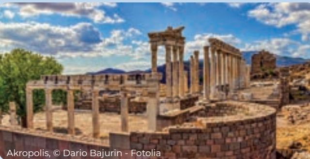
Akropolis, © Dario Bajurin - Fotolia