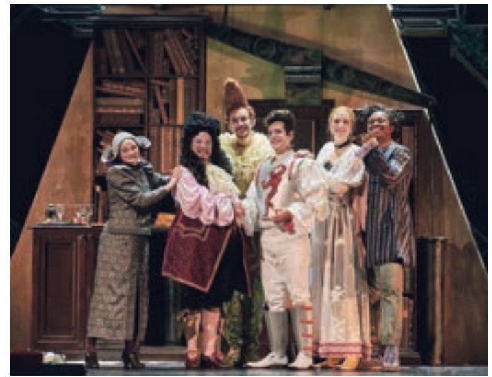
Szene aus dem »Barbier von Sevilla«

Karten gibt es auf www.staatstheater-braunschweig.de , unter 0531/123 45 67 sowie an der Theaterkasse.