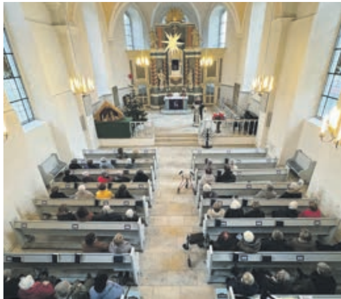
Die traditionelle Weihnachtsandacht in der St.-Stephanus-Kirche bildete den Jahresabschluss des Landfrauenvereins Schöppenstedt