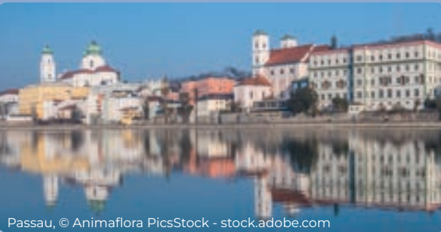
Passau, © Animaflora PicsStock - stock.adobe.com

Hauptdeck Mitteldeck Oberdeck ab 1.799,- € ab 2.199,- € ab 2.399,- €