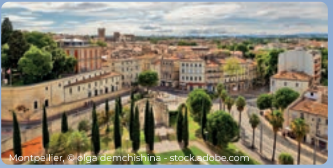
Montpellier, © Olga Demchishina - stock.adobe.com

Hauptdeck Mitteldeck Oberdeck ab 1.599,- € ab 2.199,- € ab 2.399,- €