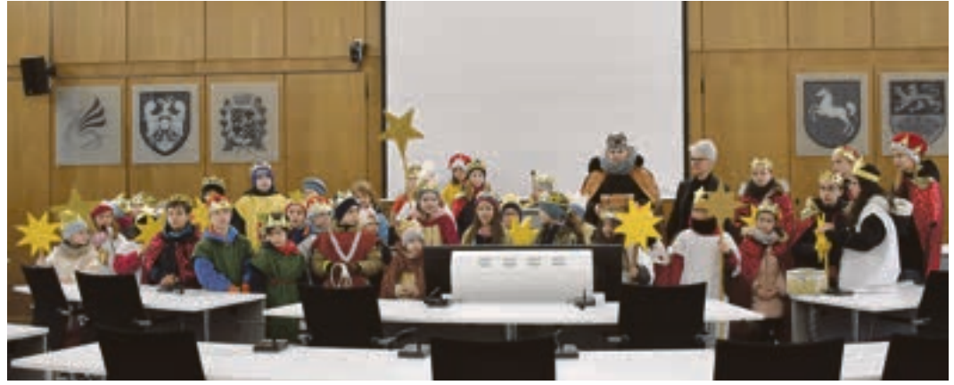
Rund 40 Sternsinger besuchten die Landkreisverwaltung und spendeten den traditionellen Segen. Begrüßt wurden sie durch Landrätin Christiana Steinbrügge

Im Anschluss spendeten die Sternsinger den traditionellen Segen. Das diesjährige Motto der 66. Sternsinger-Aktion lautet »Gemeinsam für unsere Erde – in Amazonien und weltweit«. Bei der diesjährigen Aktion wollen die Sternsinger deutlich machen, dass der Schutz von Umwelt und Kulturen weltweit eine gemeinsame Verantwortung ist. Im Fokus stehen die einheimischen Bevölkerungen der südamerikanischen Länder Amazoniens. Brandrodung, Abholzung und die rücksichtslose Ausbeutung von Ressourcen zerstörten die Lebensgrundlage der Menschen vor Ort. Dort und in vielen anderen