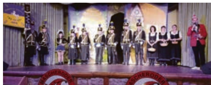
Auch »Die Schwarzen Husaren« sorgten für Stimmung