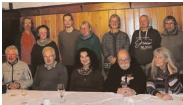
Ein Teil der Mitglieder der Veltheimer Amphibienschutzgruppe traf sich im »Lindenhof« in Veltheim zur Besprechung