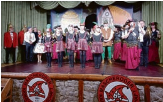
Beim Finale war die Bühne voll besetzt

Mit dem gemeinsamen Singen der »Ananas« aller Aktiven und den Veranstaltern auf der Bühne ging ein vergnüglicher und fröhlicher Abend zu Ende. Frederike