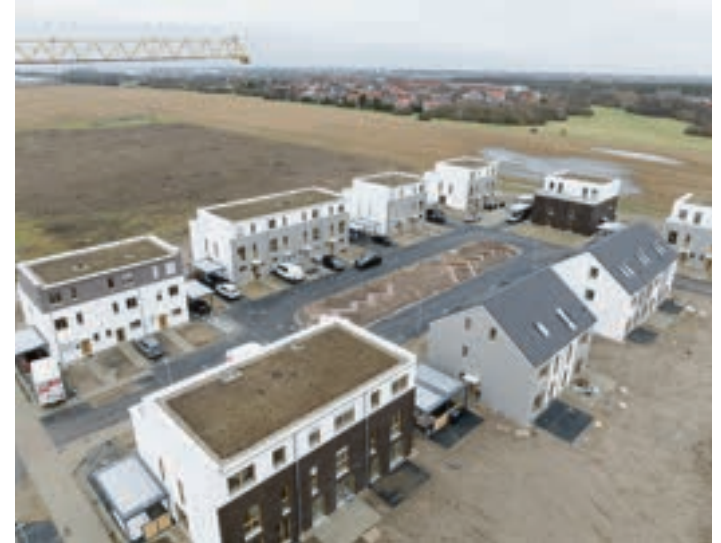
Freistehende Einfamilienhäuser, Reihenhäuser und Doppelhaushälften im Sonnenkamp

Sonderwünschen und mithilfe unterschiedlicher Grundrisspakete auf ihre persönlichen Bedürfnisse zuschneiden. Darüber hinaus werden Ausbauhäuser sowie bezugsfertige Häuser angeboten.