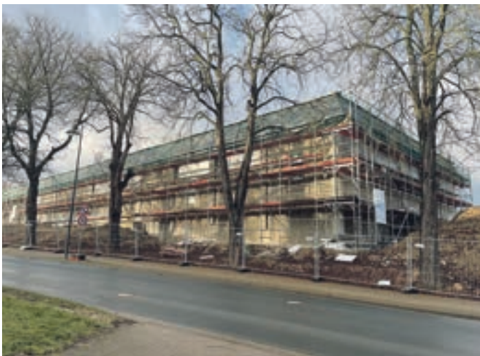
Ende März dieses Jahres soll laut Aldi der neue Markt an der Elmstraße in Schöningen eröffnet werden. Damit schließt auch die Filiale an der Hötenleber Straße